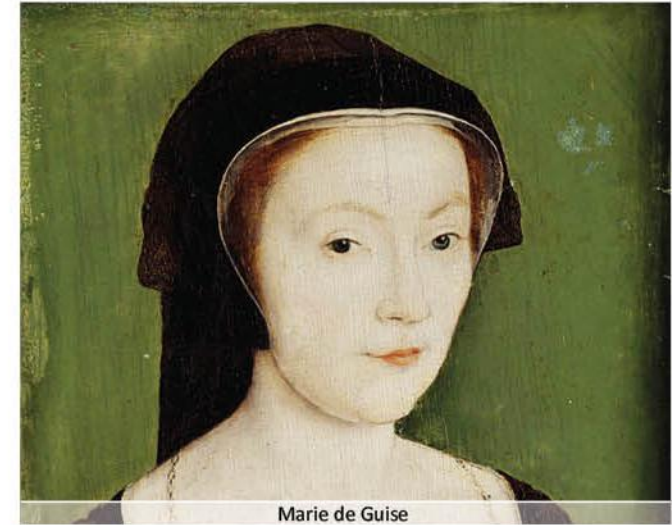
Marie de Guise

« La Vieille Alliance Franco-Écossaise pendant la Guerre de Cent Ans et au travers de deux femmes de la Renaissance, Marie de Guise et Mary Stuart »